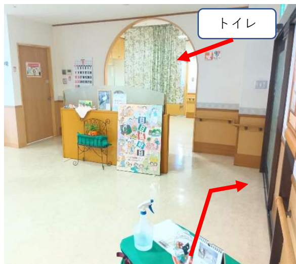
エレベーター降りて右手側の自動ドアへ進む。 自動ドアが開かない場合は手動で開けて下さい。 エレベーター降りて会場・トイレ以外のエリアは 全面立入り禁止 です。