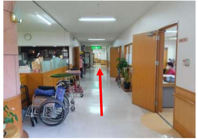
突き当りにクリニックの入口があります