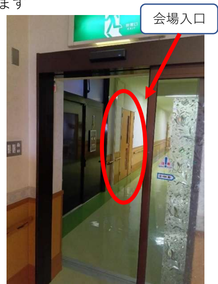
赤枠が会場入口になります