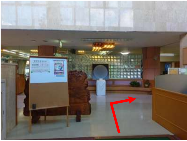
正面玄関入り右に曲がる