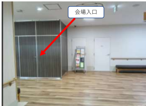
施設へ入り正面が会場入口です。