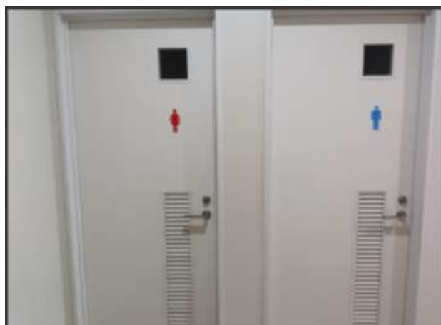
トイレは男性用1箇所・女性用1箇所・共用トイレ2箇所ございます。