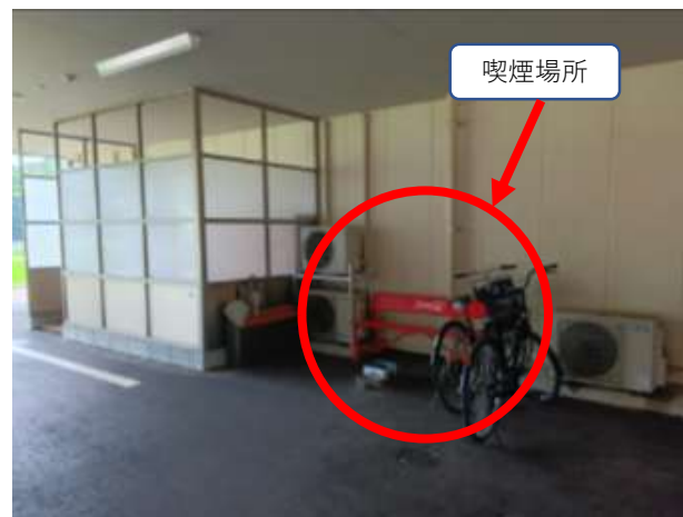
正面玄関出てすぐ右に曲がると、施設内駐車場があり、右手側に喫煙場所があります。