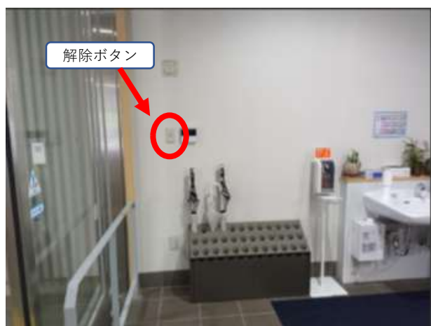
敷地外へ出られる際は、解除ボタンを押すとドアが開きます。