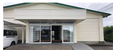
ふれあいの家入口