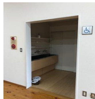
手を洗ってから席についてください