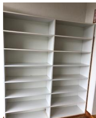
こちらで上履きに履き換えてください